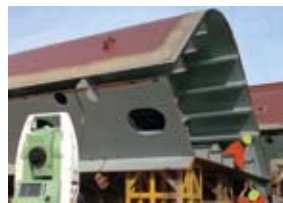
造船检测标定 (选配)