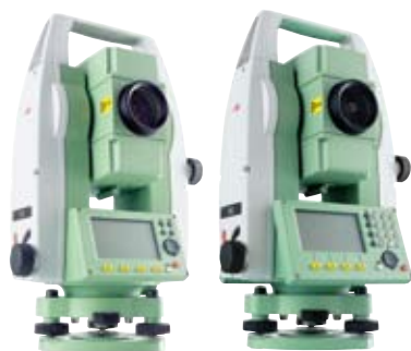
TS02系列共有14款可供选择