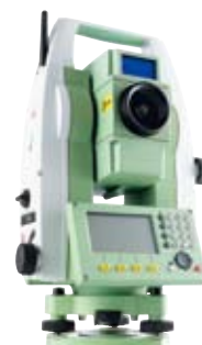
TS09系列共有3款可供选择