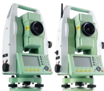
TS06系列共有10款可供选择